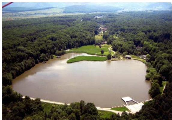
Peisajul - marele spectacol al omului, naturii și istoriei

Reuniune organizată de Consiliul Europei – Divizia pentru patrimoniu cultural, peisaj și amenajarea teritoriului (Direcția de Cultură și patrimoniu natural și cultural), în colaborare cu Ministerul Dezvoltării, Lucrărilor Publice și Locuințelor, Ministerul Culturii și Cultelor, Programul Națiunilor Unite pentru Dezvoltare România, Consiliul Județean Sibiu și Primăria municipiului Sibiu.